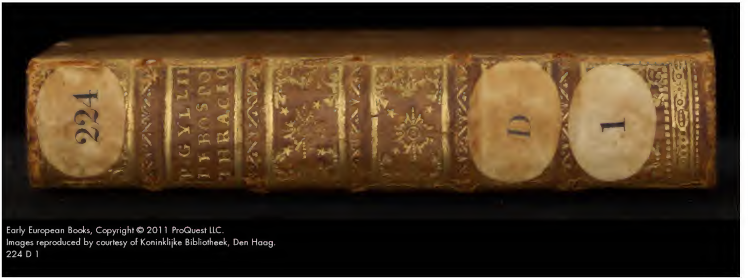
224 D 1